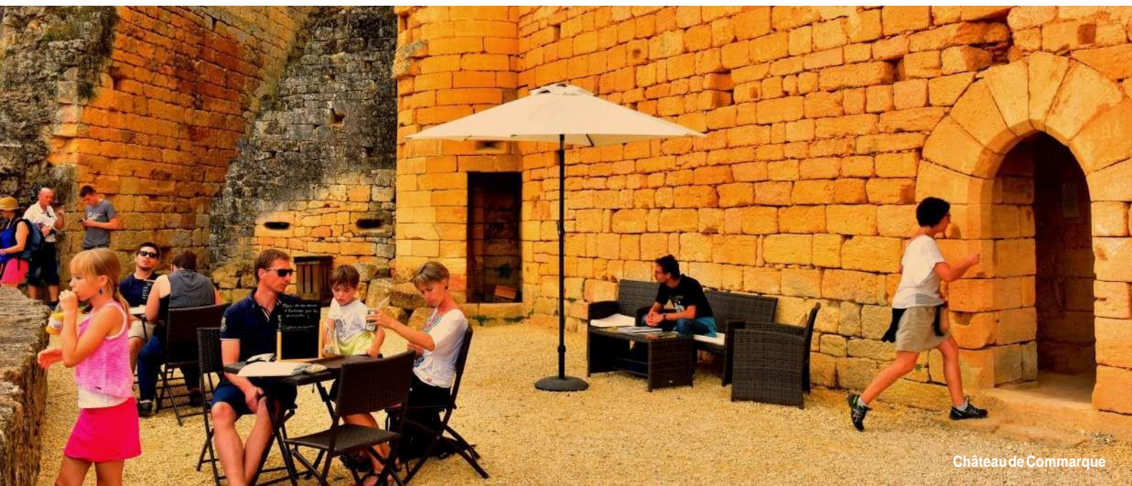
Château de Commarque