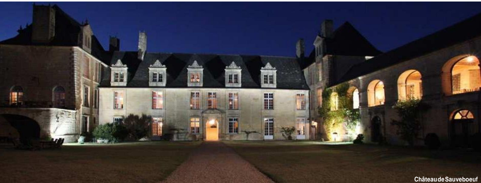
Château de Sauveboeuf