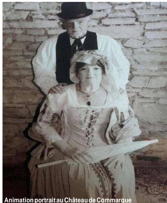
Animation portrait au Château de Commarque