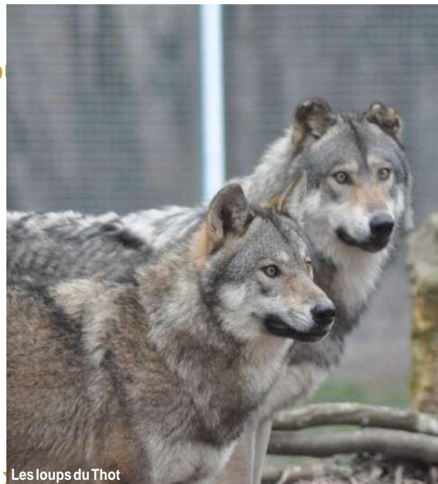
Les loups du Thot