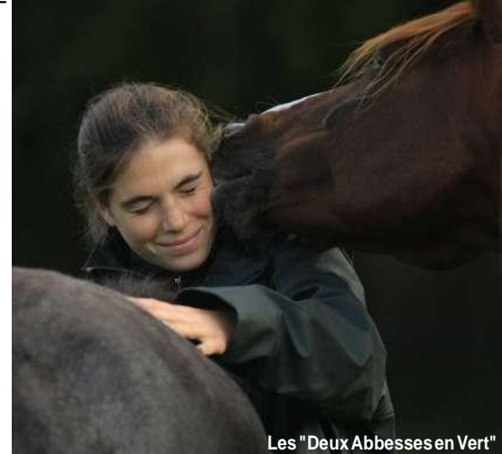
Les "Deux Abbesses en Vert"

Le cheval est un expert en communication non verbale et un révélateur des intentions sous-jacentes de notre comportement : il nous renvoie instantanément l'impact de notre énergie ou de nos émotions.