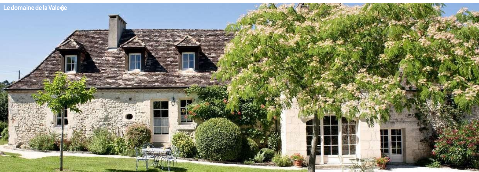
Le domaine de la Vale

www.lavaleperigord.com/fr/ferme-decouverte