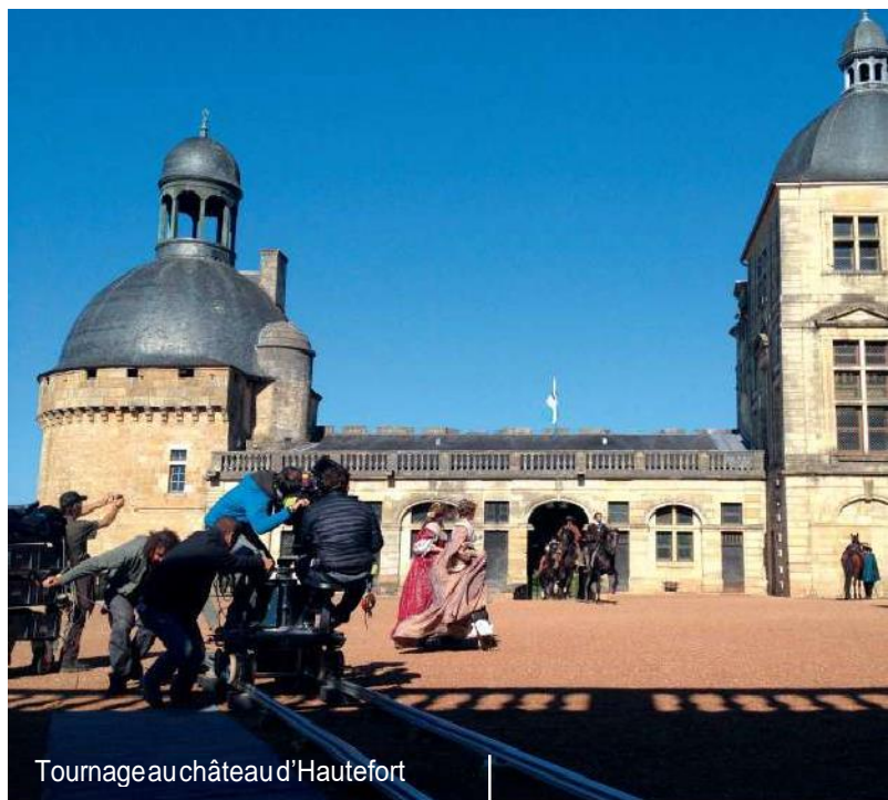
Tournage au château d'Hautefort