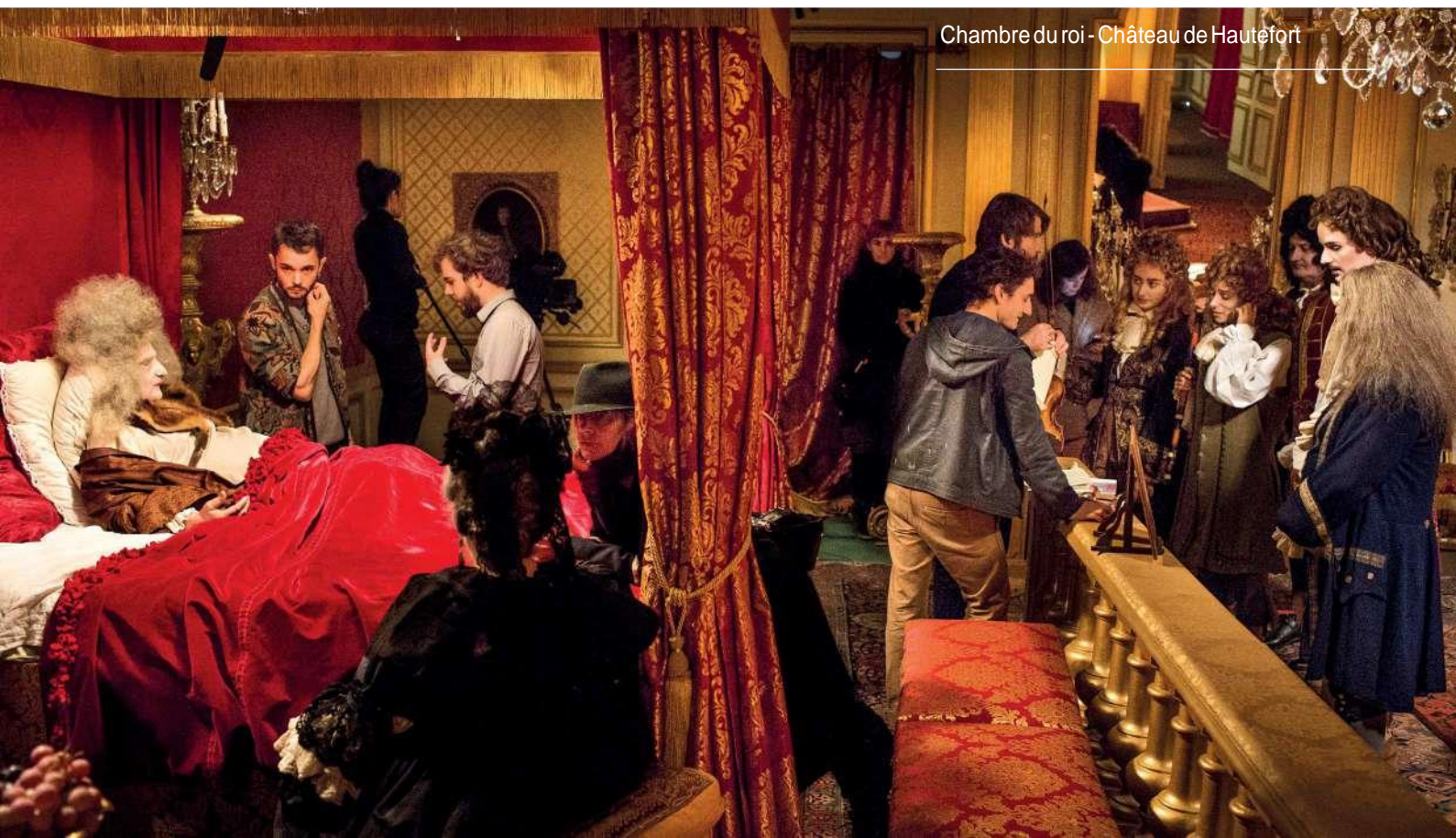
Chambre du roi - Château de Hautefort